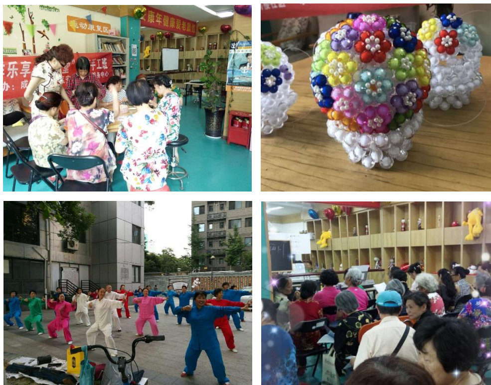
过街楼社区公益课堂

6月，过街楼“花样乐享公益课堂”持续开课。快乐微信学习班学习了地图导航、手机清理等，创意手工班的小辣椒、转运珠绚烂多姿，太极班整齐统一的服装、招式引来一批批路人学徒，合唱班的歌声引人共鸣，社区居民的闲暇生活也是多姿多彩。