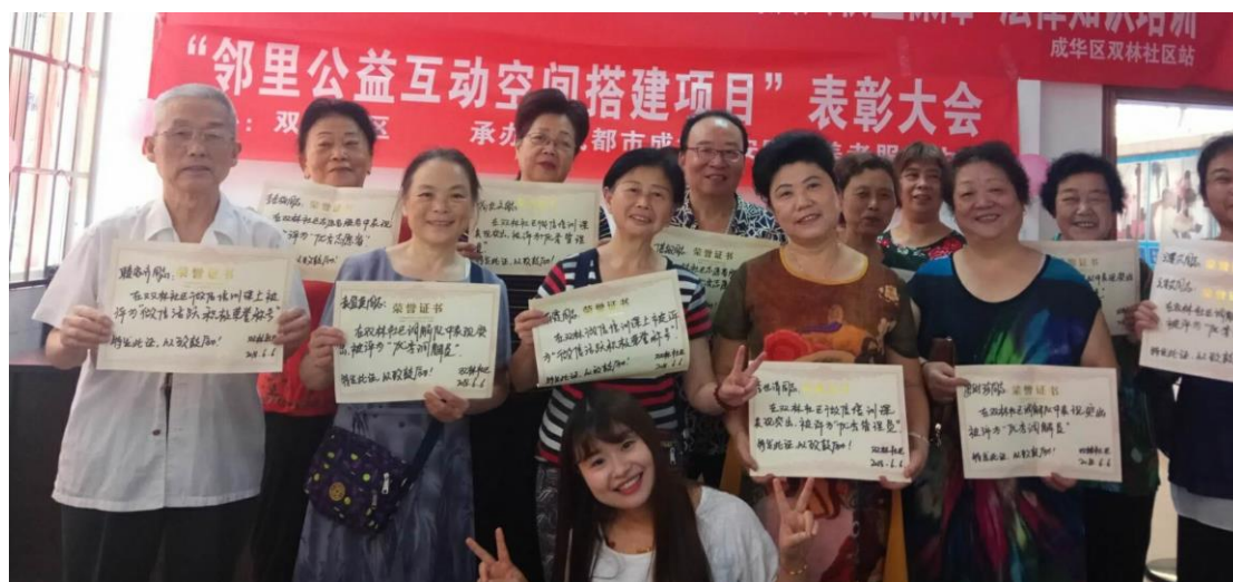
表彰大会活动现场